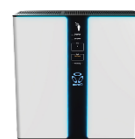
3モード 空気清浄機