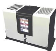
ARV-O3ME 空間除菌 1g/h