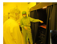
クリーンルーム内